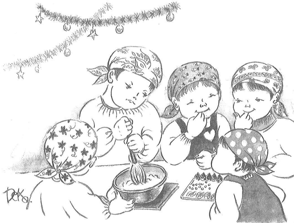
「みんなでケーキを作ったよ」

●今年の聖句 あなたがたは何をするにも、人に対してではなく主に対するように、心から行いなさい。(コロサイの信徒への手紙3:32)